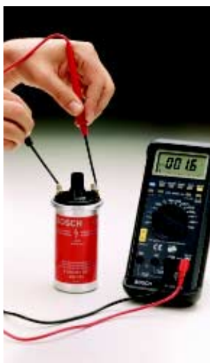
◀ Medición del enrollamiento primario