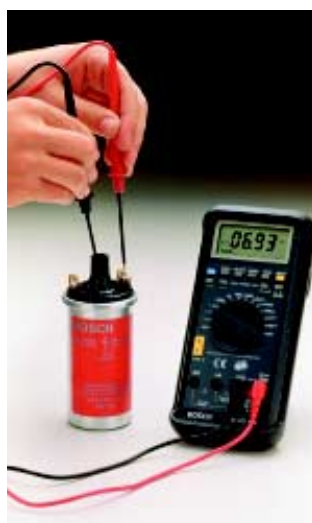
▶ Medición del enrollamiento secundario